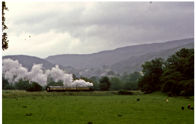
De toeristentrein Carrog naar Llangollen