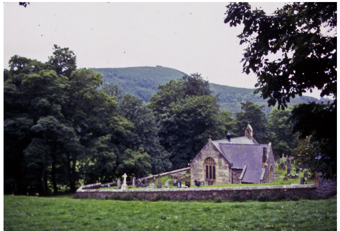
Llansylio church op weg naar Llangollen

Ik laat Bala links liggen en ga op weg naar Llangollen naar de jeugdherberg. Rond 12 uur ben ik in Llangollen. Ik neem een kijkje op het station waar een toeristische lijn wordt onderhouden met locomotieven onder stoom. Het is een mooi authentiek station. Vlak daarbij is het centrum en zoek ik een bakker met koffiesalon. Dat is genieten van de warmte en de koffie. Het is druk en ik deel mijn tafel met een ouder echtpaar, dat per auto Wales aan het verkennen is.