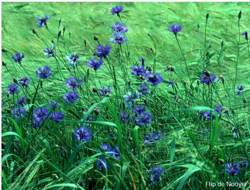
Flip de Nooyer

Korenbloemen komen in allerlei typen graanakkers voor, zowel op zure als op kalkrijke bodem. Zwarte klei- en leemgronden worden echter gemeden. Daarnaast komt Korenbloem tegenwoordig regelmatig voor op omgewerkte plekken in wegbermen, samen met onder andere Herik en klaprozen. Haar voorkomen daar is echter niet bestendig. In graanakkers wordt Korenbloem stevast vergezeld door een aantal andere akkerplanten, zoals Grote windhalm, Akkerviooltje, Ringelwikke en Zwaluw tong. Op zure zandgronden komen daar ook nog vaak Slofhak en Bleekgele hennepnetel bij. Op kalkrijke gronden onder meer klaprozen, Echte kamille en Klimopereprijs.